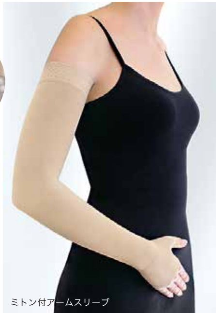
ミトン付アームスリーブ